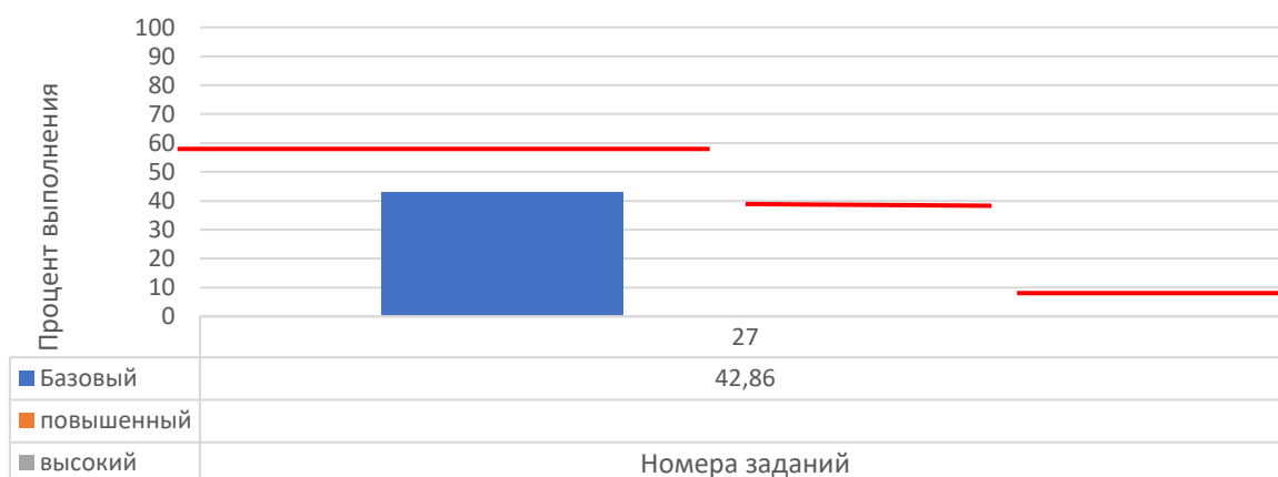
Рисунок 2. Задания, по которым участники не преодолели минимальный порог

На рисунке 2 представлены данные по заданиям (%), уровень выполнения которых не преодолел минимальный порог. Красной линией отражен минимальный порог выполнения для каждого уровня сложности: базовый – 60%, повышенный – 40%, высокий – 10%.